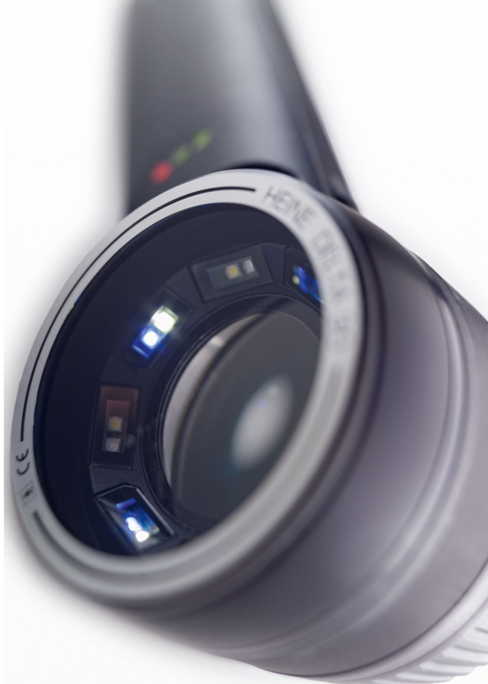
Wizualizacja z nowym HEINE DELTA 30 PRO