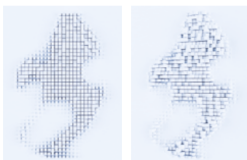
Wizualizacja za pomocą konwencjonalnego dermatoskopu

Podczas badania skóry liczą się wszystkie małe rzeczy. Właśnie dlatego zmieniliśmy rozmieszczenie diod LED HQ w nowym dermatoskopie HEINE DELTA 30 PRO. Dzięki zmianie położenia diód LED światło dociera do głębszych warstw skóry – dając niezwykle żywe, przestrzenne wrażenie zmian, podobne do obrazu 3D.