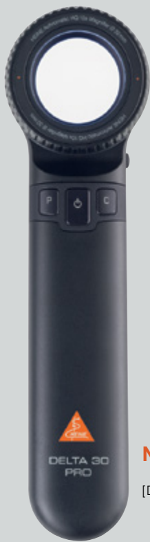
[DELTA 30 PRO]